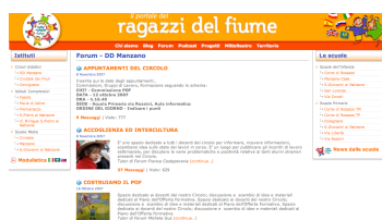
Scambio di informazioni, materiali e lavori di gruppo che passano attraverso il Forum dei Docenti