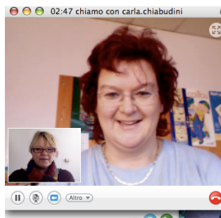
Docenti comunicano e lavorano da scuole diverse tramite portatili multimediali, ADSL e Skype