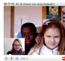
Circolo Didattico di Manzano Comunicare e condividere risparmiando